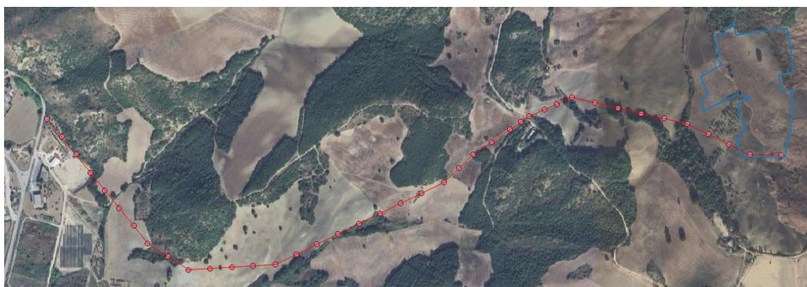
Figura 1. Tracciato cavidotto Media Tensione